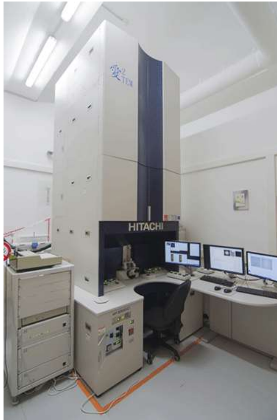
Figure 1 : le microscope électronique en transmission I2TEM