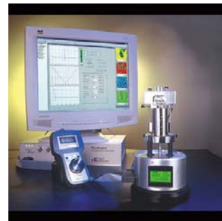
Photographie du microscope à force atomique PicoForce.